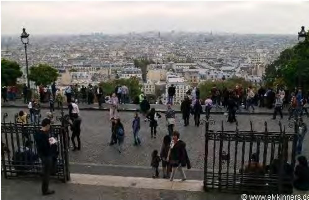
Montmartre und die Maler.