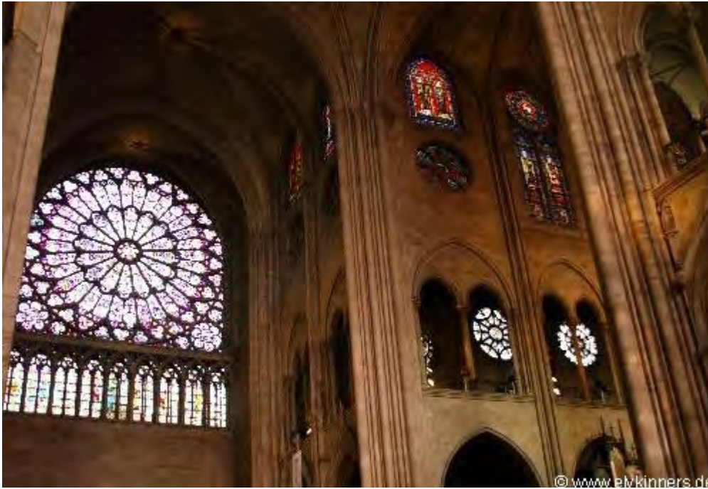
Auch die Basilique du Sacré-Coeur ist Pflichtprogramm