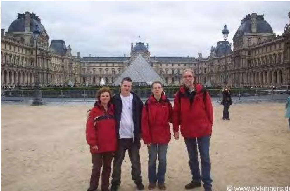
Der Hype um die Mona Lisa