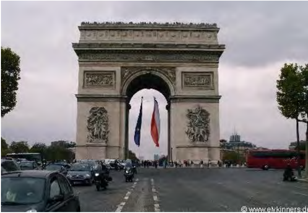
und oben einen Blick auf die Champs-Élysées